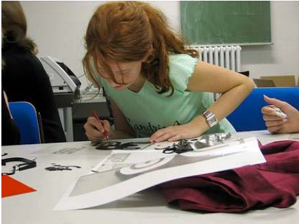
Im 4. Schritt werden die Grafiken entgittert.