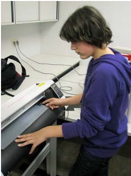
Im 3. Schritt werden die Folien im Schneideplotter zugeschnitten