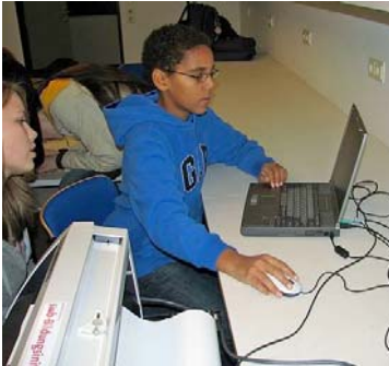
1. Schritt ist es eine Grafik zu erstellen