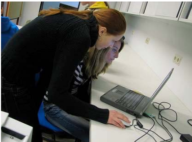
2. Schritt ist es die Daten zum Schneideplotter zu senden.